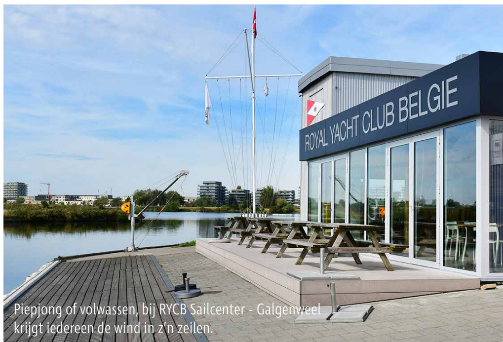
Piepjong of volwassen, bij RYCB Sailcenter - Galgenweel krijgt iedereen de wind in z'n zeilen.